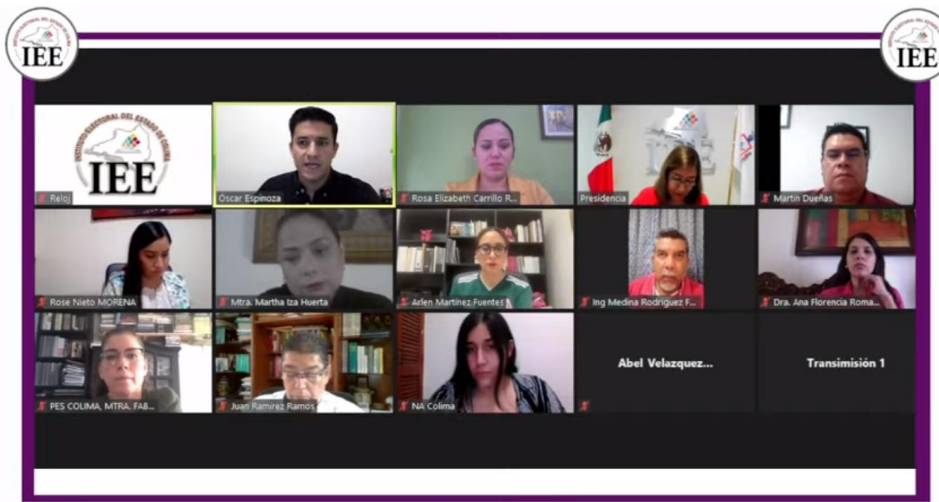
Sesión Extraordinaria del Consejo General

Para el 09 de noviembre de 2022, el Gobierno del Estado de Colima autorizó una ampliación parcial al Presupuesto de Ingresos de este Instituto para el año 2022, por la cantidad de $1'523,500.00 (Un millón quinientos veintitrés mil quinientos pesos 00/100 M.N.), para cubrir los conceptos de seguridad social, así como nóminas de sueldos de